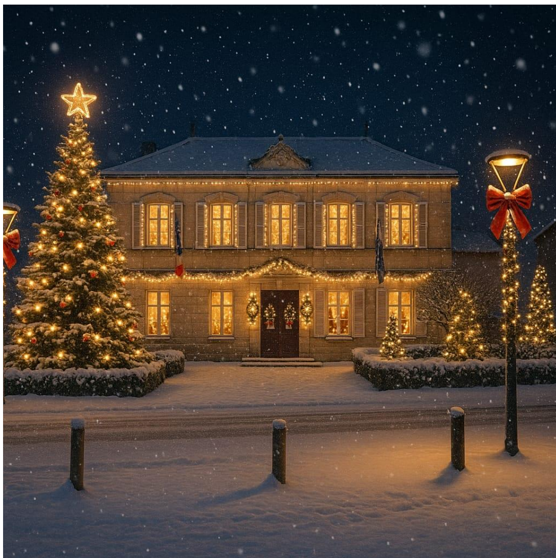
Photo réalisée à l'aide de l'intelligence artificielle

L'équipe municipale vous souhaite de joyeuses fêtes de fin d'année.