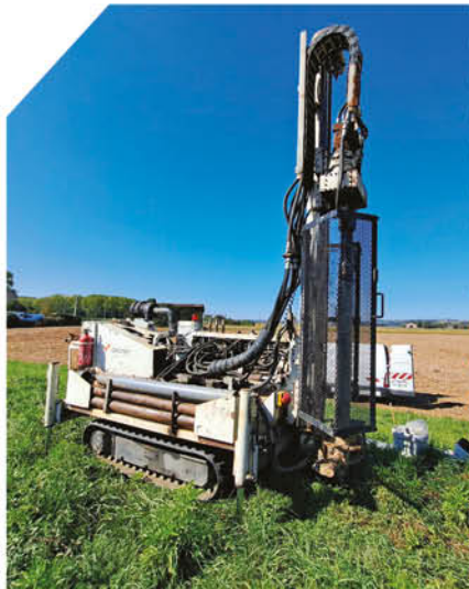
Sondages octobre 2023 sur Bourdelles

Dans ce cadre, nous avons lancé plusieurs études dont des analyses de terrain. C'est la raison pour laquelle de nombreux piquets ont été implantés par notre prestataire qui réalise des sondages géotechniques sur les 28 km de digues. Ces sondages permettront de connaître la structure et la composition des ouvrages pour notamment définir d'éventuels travaux de consolidation.